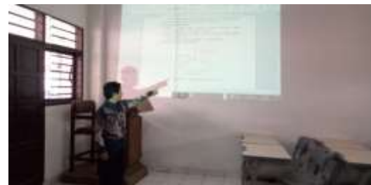
Gambar 4. Menjelaskan system kelistrikan mesin bubut