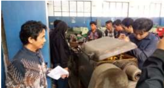
Gambar 5. Pelaksanaan Kegiatan Rekondisi Kelistrikan pada mesin bubut terdiri dari elemen-elemen kontrol yang sangat berpengaruh bagi mesin bubut itu sendiri, dikarenakan tanpa adanya elemen-elemen kontrol yang benar, mesin bubut tidak bisa beroperasi sesuai dengan fungsinya.