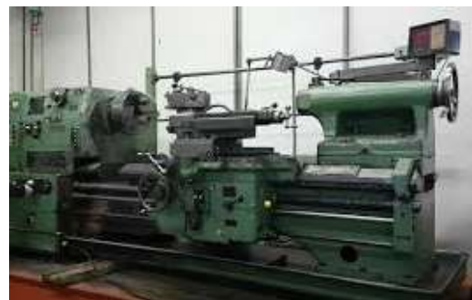
Gambar 2. Mesin Bubut

Tujuan rekondisi adalah untuk mengembalikan kondisi (rekondisi) mesin bubut Light Gap Bed Lathe Model CQ 6250 yang difokuskan pada masalah perbaikan sistem kelistrikan, dan pengujian kinerja mesin (putaran spindle dan motor utama, uji jalan, serta getaran motor utama).