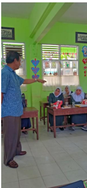
Gambar 4. Pemateril memberikan pelatihan

Pemateri menyampaikan dalam penulisan kajian teori harus sesuai dengan judul yang dipilih. Pengembangan kajian teori dikembangkan melalui kajian teori para ahli, dapat berupa buku, jurnal atau sumber lainnya yang dapat dipercaya keabsahaannya. Pemateri menyampaikan untuk metodologi penelitian terdapat setting penelitian dan subyek penelitian. Selain itu ada perencanaan tindakan (terdiri dari skenarin pembelajaran yang dilaksanakan, persiapan alat dan media serta hal-hal lain yang dibutuhkan), pelaksanaan tindakan ( terdiri dari deksripsi tindakan yang dilaksanakan), evaluasi, metode yang digunakan, instrumen, analisis data (terdiri dari prosedr analisis yang tepat dengan topik).