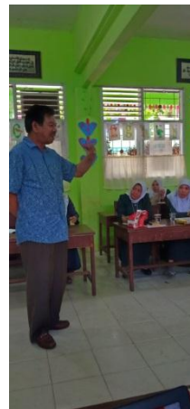
Gambar 3. Pemateri memberikan pelatihan

Setelah judul, pemateri membahas mengenai latar belakang masalah. Beliau menyampaikan bahwa dalam later belakang harus ada pembelajaran ideal (berdasarkan teori), kondisi yang terjadi dilapangan berdasarkan pengamatan, kajian teoritik yang mendukung tindakan yang dipilih, hasil penelitian yang relevan dan alasan perlunya diadakan penelitian ini.