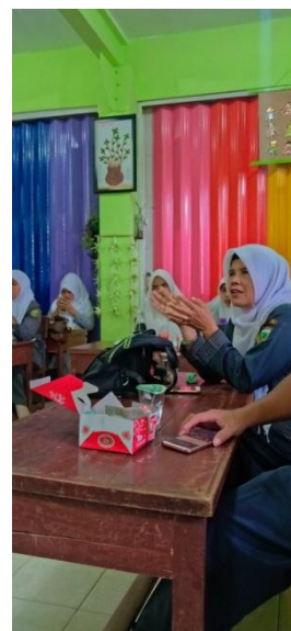
Gambar 5. guru sedang bertanya

Selama pelatihan berlangsung guru diajarkan secara langsung mengenai kiat-kiat menulis PTK jika ada pertanyaan guru langsung bertanya sehingga pertanyaan tersebut dijawab oleh prof Yal.