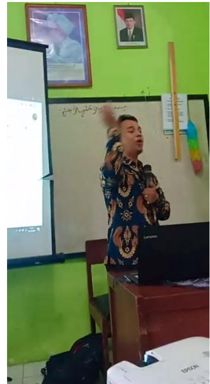
Gambar 2. pemateri memberikan Materi

Pada kesempatan ini pemateri juga mengemukakan bahwa PTK memiliki karakteristik sebagai berikut: