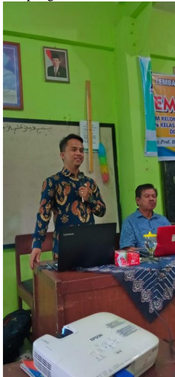
Gambar 1. pemateri memberikan materi

siswa, kepala sekolah, hasil belajar, suasana lingkungan dan pengelolaan kelas.