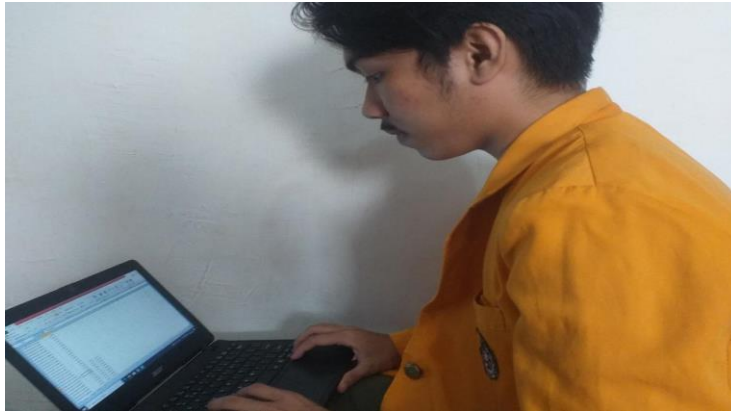
Gambar 2. Kegiatan kalkulasi anggaran pencairan dana dinas-dinas dan instansi di bawah naungan pemerintahan Kabupaten Gowa menggunakan aplikasi excel dan pengarsipan berkas digital sesuai nomor berkas.