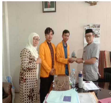
Gambar 7. Foto Bersama Kabid Bidang Pembinaan Pendidik dan Tenaga Kependidikan , dan Fasilitasi PAUD, DIKDAS, DIKTI & DIKMAS dan Pembimbing (lokasi ) PKL.