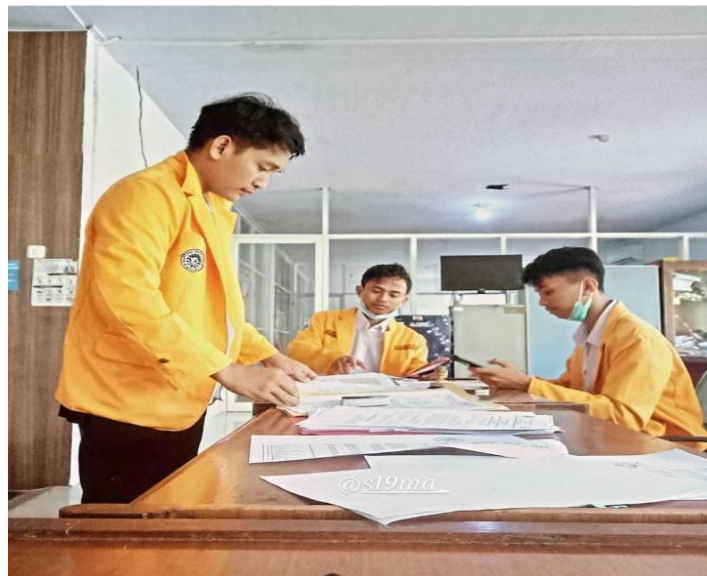
Gambar 1. Menyusun Laporan NPHB SD-SMP Setiap Provinsi di Sulawesi Selatan Gambar 1 menunjukkan kerja tim PKL mengenai pemeriksaan berkas ....

Sebagai seorang praktikan, tentunya masih sangat minim pengalaman dan pengetahuan, maka penulis meminta arahan pada pegawai maupun pembimbing lalu penulis dan teman kelompok yang lain membagi tugas sesuai dengan porsi dan tenggat waktu yang telah disepakati guna mengefisienkan waktu yang diberikan.