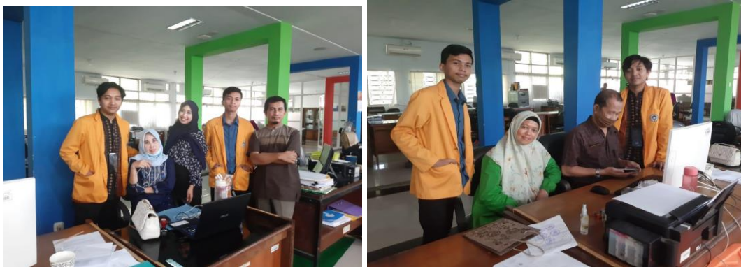
Gambar 8. Foto Bersama Staff Bidang Pembinaan Pendidik dan Tenaga Kependidikan , dan Fasilitas PAUD, DIKDAS, DIKTI & DIKMAS.

Dampak yang ditimbulkan dari kegiatan Praktik Kerja Lapangan (PKL) yaitu Menambah pengalaman Mahasiswa dalam dunia kerja serta meningkatkan kemampuan berkomunikasi serta melatih ketelitian mahasiswa dalam mengerjakan tugas yang diberikan.