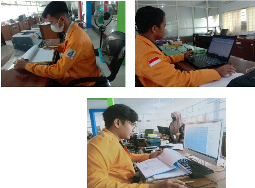
Gambar 2. Praktikan Memeriksa Data Jumlah TPP, Pajak, dan Nilai TPP yang diterima Pegawai dari Rekapitulasi Daftar Penerimaan Tambahan Penghasilan Pegawai (TPP) di Setiap Kabupaten. Gambar 2 menampilkan kerja mandiri sesuai dengan masing-masing dalam hal .....