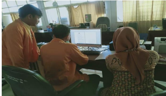
Gambar 5. Praktikan Merevisi SK Gubernur untuk diajukan kepada Biro Hukum PEMDA SULSEL