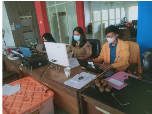
Gambar 6. Praktikan Menyusun Format Laporan Perjalanan Dinas pegawai