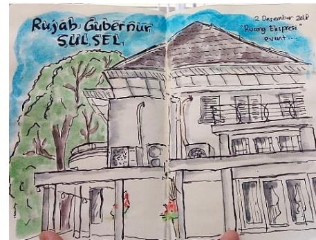
Gambar 8. Sket karya Mutiah Sari Mustakim