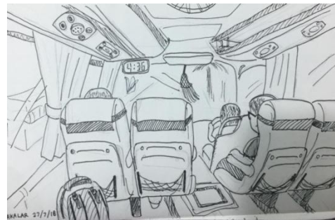
Gambar 5. Sket karya Tristania Indah W

Pada karya sket di atas menampilkan objek manusia yang menggambarkan suasana sedang berkumpul bersama di cafe, hampir di seluruh bagian objek pada sket ini terdapat garis lurus. Namun masih terlihat berdimensi, dengan adanya kesan arsiran gelap terang. Dalam penggambaran objek seperti kartun atau komik, akan tetapi sket yang dikerjakan tidak diberikan pewarnaan, melainkan hitam putih saja.