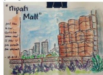
Gambar 9. Sket Mutiah Sari Mustakim

Dalam karyanya tersebut menggambarkan sebuah bangunan yaitu rumah jabatan Sulawesi Selatan Dalam pengerjaannya begitu rapi, karena dalam goresan atau tarikan garisnya begitu nampak rapi dalam artian sket ini tidak spontanitas. Dari gaya goresan yang ini sangat memperhatikan kedetailan wujud apa yang dilihat dan arsiran yang digunakan satu arah dan pengulangan garis yang nampak pada objek pohon. Dengan warna yang sesuai objek apa yang dilihat.