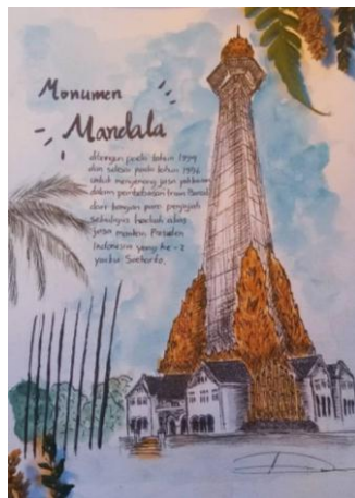
Gambar 7. Sket karya Dwiki Istiqamah M

Berdasarkan hasil penelitian bahwa dari banyaknya karya yang dibuat oleh Dwiki Istiqamah M karya sket di atas merupakan salah satu karya yang bertemakan suasana objek orang didalam mobil sedang memegang ponselnya. Terdapat jelas unsur garisnya, seperti yang nampak adalah garis panjang, garis tebal, tipis, lengkung, gelap dan terang. Pada karya sket tersebut memiliki karakter tersendiri, menumpuknya warna yang terlihat jelas, dengan warna-warna yang gelap, seperti hitam, coklat, biru dan hijau, sehingga warna itu sendiri yang mewakili garis dan menjadi berdimensi didalam sket ini dan teknik yang digunakan yaitu teknik basah terlihat begitu ekspresif.