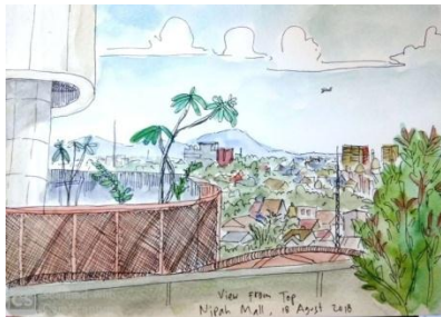
Gambar 1. Sket karya Shanti Yani

Diatas merupakan dari karya ket komunitas Indonesia Sketch Makasar (ISM) yaitu Shanti, yang karyannya memiliki karakter tersendiri, menggambarkan suasana tentang landscape pada suatu tempat yaitu disebuah Mall, dari lantai atas. Pada karya sketsa tersebut sang pengkarya berusaha untuk mengabadikan bagaimana keadaan tempat tersebut. Kemudian pengerjaannya begitu dengan sangat pelan-pelan, dan memiliki tarikan-tarikan garis yang begitu hati-hati, dimana terdapat pengulangan garis-garis silang, lurus dan lainnya. Dan warna yang digunakan warna-warna lembut, dan juga sangat memperhatikan kerapian.