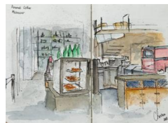
Gambar 3. Sket karya Christian Abdi Guna (Foto. Basuki, 3 Juli 2019)