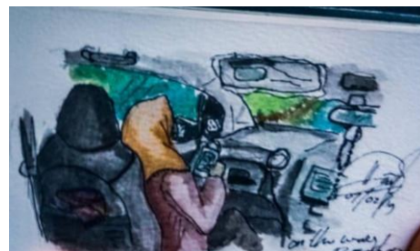
Gambar 6. Sket karya Dwiki Istiqamah M