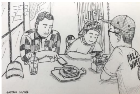
Gambar 4. Sket karya Tristania Indah W