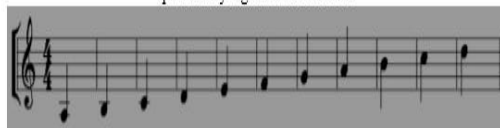
Gambar 4 Posisi suara anak jenis rendah (wilayah nadanya antara nada a – d ") dalam garis paranada yang bertanda kunci G