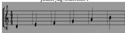
Gambar 5 Posisi suara anak jenis tesitura (wilayah nadanya antara nada d – b") dalam garis paranada yang bertanda kunci G