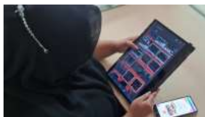
Gambar 6. Proses Publikasi Dokumentasi Kegiatan KKN di Akun Instagram Pusat KKN

Optimalisasi akun dilakukan sebagai solusi dari akun instagram Pusat KKN yang masih kurang aktif dalam membagikan info serta kegiatan KKN yang telah dilakukan oleh mahasiswa selama melaksanakan KKN. Upaya yang kami lakukan yaitu aktif membagikan dokumentasi kegiatan KKN yang telah dilakukan oleh mahasiswa serta membuat tampilan instagram lebih menarik. Adapun sumber dokumentasi yang dibagikan diperoleh dari mahasiswa maupun Dosen Pembimbing Lapangan (DPL)