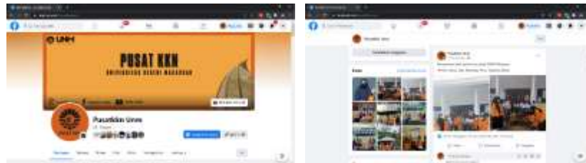
Gambar 5. Tampilan Page akun Facebook Pusat KKN UNM