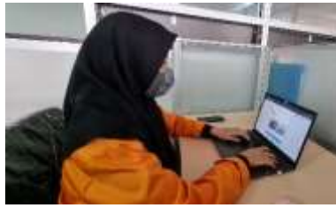
Gambar 2. Proses Publikasi Dokumentasi Kegiatan KKN di Akun Facebook Pusat KKN

Selain membagikan dokumentasi, kami juga memperbaharui tampilan page dari akun facebook Pusat KKN agar lebih menarik. Kami membuat foto sampul yang akan digunakan di akun facebook dengan melakukan desain menggunakan tools desain grafis online yaitu Canva . Adapun akun facebook dari Pusat KKN adalah “PusatKkn Unm”.