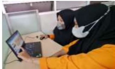
Gambar 3. Proses Desain Foto Sampul Facebook Pusat KKN UNM

Selain membagikan dokumentasi, kami juga memperbaharui tampilan page dari akun facebook Pusat KKN agar lebih menarik. Kami membuat foto sampul yang akan digunakan di akun facebook dengan melakukan desain menggunakan tools desain grafis online yaitu Canva . Adapun akun facebook dari Pusat KKN adalah “PusatKkn Unm”.