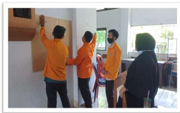
Gambar 4. Proses pemasangan denah yang dilapisi akrilik

Tak lama menunggu hasil koreksi dari pembimbing dan Ketua Jurusan, akhirnya hasil koreksi tersebut langsung dilaksanakan dan diperbaiki. Sembari memperbaiki denah akibat koreksi yang ada, beberapa mahasiswa KKN Domisili Kampus Proker 2 mendatangi Toko Surya Acrilik Makassar di Jl. Sungai Pareman III No.32, Lajangiru, Kec. Ujung Pandang, Makassar sebagai penyedia frame yang akan digunakan. Lanjut pun pada proses pemasangan denah yang dilapisi akrilik. Tiap-tiap lantai di Jurusan Matematika dipasang denah tersebut. Mulai dari pemasangan denah lantai 1 hingga lantai 3.