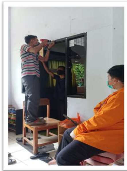
Gambar 7. Proses pencabutan papan nama lama Jurusan Matematika