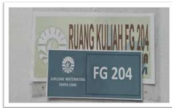
Gambar 8. Papan nama ruangan yang lama

Akhirnya tiba pada proses pemasangan. Setelah mencabut semua papan nama lama kemudian meregenerasinya dengan papan nama yang baru. Hal tersebut dilakukan untuk setiap ruangan yang ada di Jurusan Matematika. Proses pengerjaan regenerasi papan nama memakan waktu 2 pekan, yakni mulai 12 – 23 Oktober 2020.