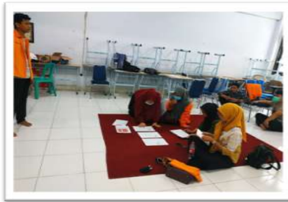
Gambar 1. Rapat/briefing sebelum melakukan observasi lokasi denah

Sebelum melakukan kegiatan regenerasi komplemen denah dan papan nama ruangan Jurusan Matematika dilakukan rapat/ briefing sesama anggota program kerja KKN Kampus Domisili di Jurusan Matematika, Fakultas Matematika dan Ilmu Pengetahuan Alam, Universitas Negeri Makassar. Hal ini bertujuan untuk memaksimalkan sebaik mungkin waktu pengerjaan suatu kegiatan dan meminimalisir kesalahan suatu kegiatan. Observasi pada lokasi denah Jurusan Matematika dilakukan sehari setelah rapat/ briefing dilaksanakan. Observasi pada lokasi denah dilakukan pada tanggal 21 September 2020. Selanjutnya observasi papan nama ruangan dilakukan pada tanggal 12 Oktober 2020. Observasi-observasi tersebut dilakukan untuk mengetahui perihal desain dan letak pemasangan denah serta letak pemasangan papan nama ruangan di Jurusan Matematika. Selain itu guna mengetahui pembaruan nama dosen di tiap ruangan apabila hal tersebut terjadi.