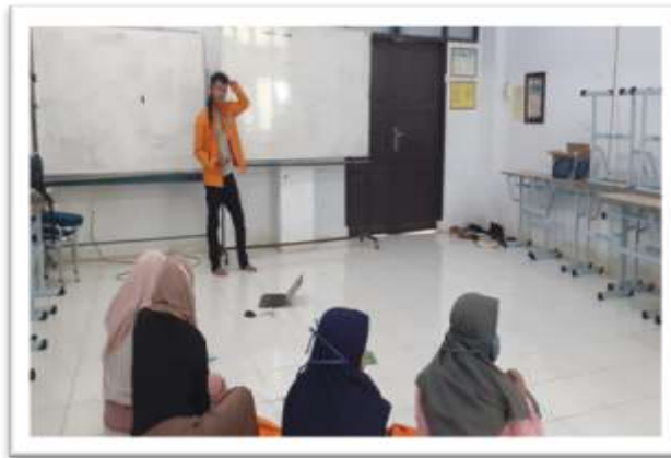
Gambar 6. Rapat/briefing sebelum melakukan observasi papan nama ruangan

Setelah proses pengerjaan denah baru Jurusan Matematika selesai, lanjut pada program kerja berikutnya yaitu pembaruan nama-nama ruangan. Kegiatan pertama yang dilakukan yaitu rapat/ briefing yang dilanjutkan dengan observasi sekaligus mengumpulkan data nama ruangan dan nama dosen di setiap ruangan yang akan dicantumkan pada papan nama ruangan di Jurusan Matematika.