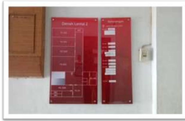
Gambar 5. Denah baru Jurusan Matematika

Setelah proses pengerjaan denah baru Jurusan Matematika selesai, lanjut pada program kerja berikutnya yaitu pembaruan nama-nama ruangan. Kegiatan pertama yang dilakukan yaitu rapat/ briefing yang dilanjutkan dengan observasi sekaligus mengumpulkan data nama ruangan dan nama dosen di setiap ruangan yang akan dicantumkan pada papan nama ruangan di Jurusan Matematika.