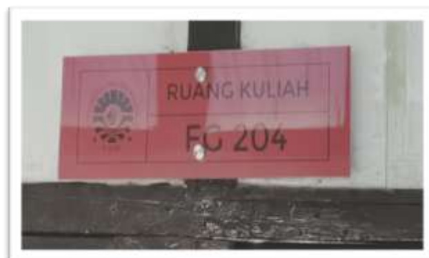
Gambar 9. Papan nama ruangan yang baru

Akhirnya tiba pada proses pemasangan. Setelah mencabut semua papan nama lama kemudian meregenerasinya dengan papan nama yang baru. Hal tersebut dilakukan untuk setiap ruangan yang ada di Jurusan Matematika. Proses pengerjaan regenerasi papan nama memakan waktu 2 pekan, yakni mulai 12 – 23 Oktober 2020.