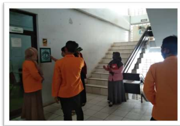
Gambar 2. Observasi denah Jurusan Matematika

Setelah melakukan observasi, akhirnya desain ukuran dan letak pemasangan telah didapatkan. Beranjak dari hasil observasi tersebut kegiatan selanjutnya yakni membuat rancangan desain dan juga estimasi dana denah jurusan yang baru.